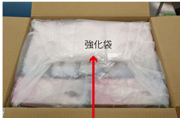
強化袋の開封口をテープで留めてから、 段ボールを閉じます